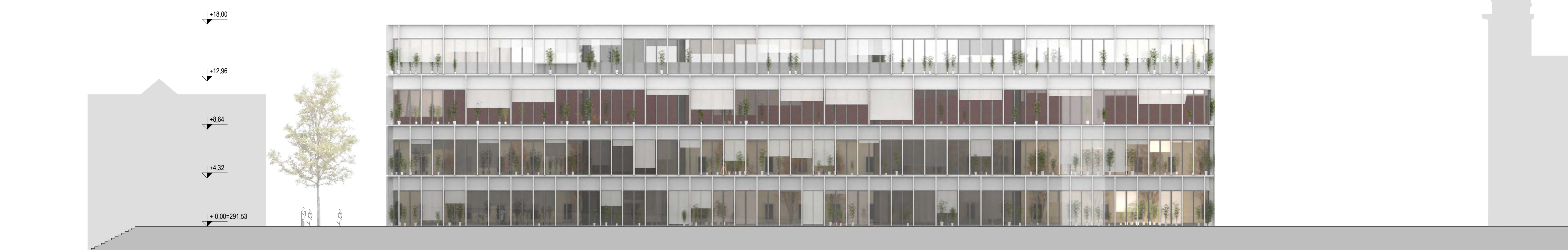
VZHODNA FASADA, M 1:200