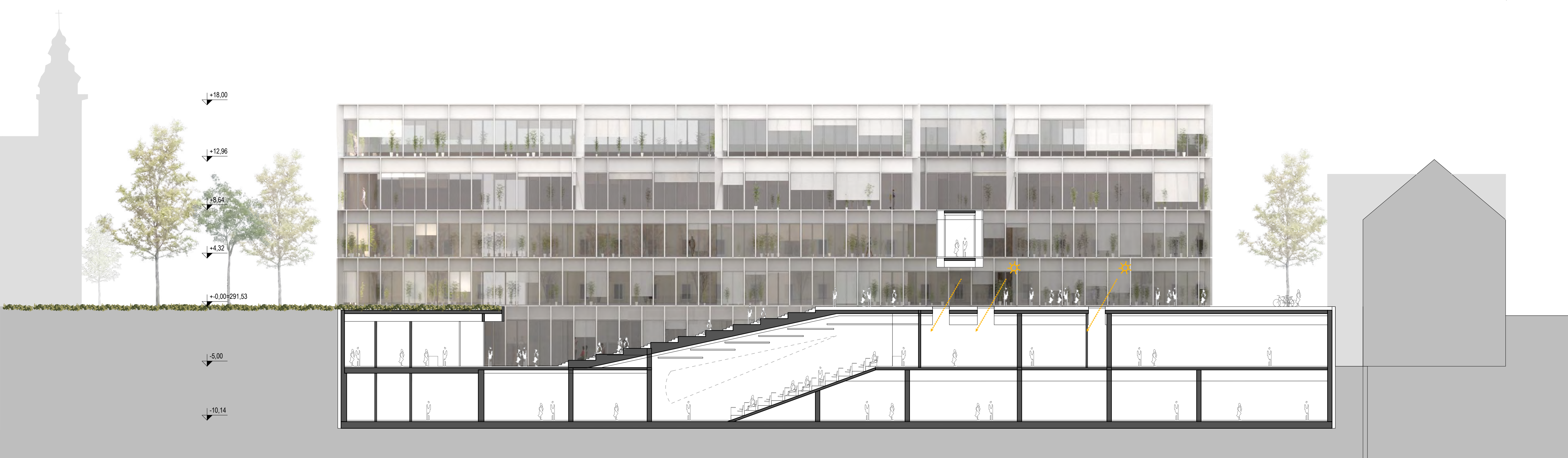
ZAHODNA FASADA / VZDOLŽNI PREREZ AA, M 1:200