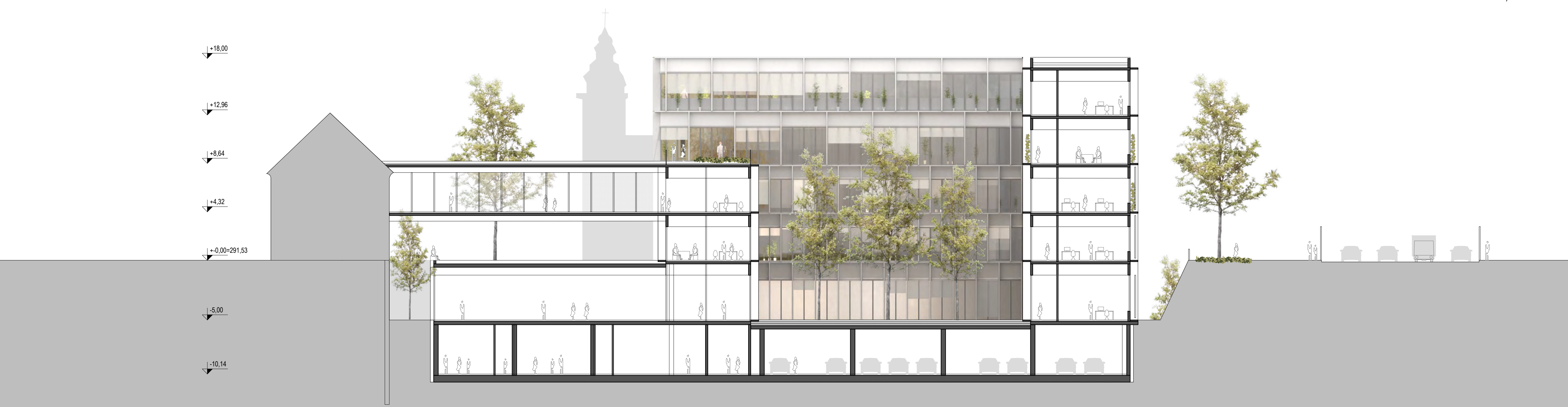
PREČNI PREREZ CC / FASADA NOTRANJEGA ATRIJA, M 1:200