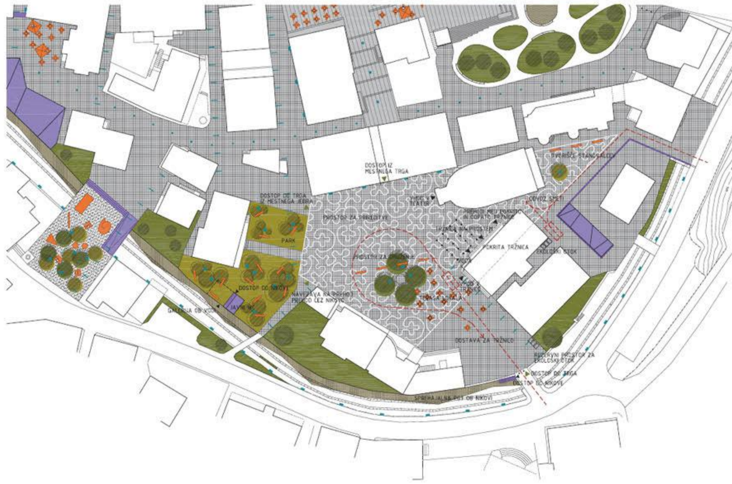
TRŽNICA m = 1:200